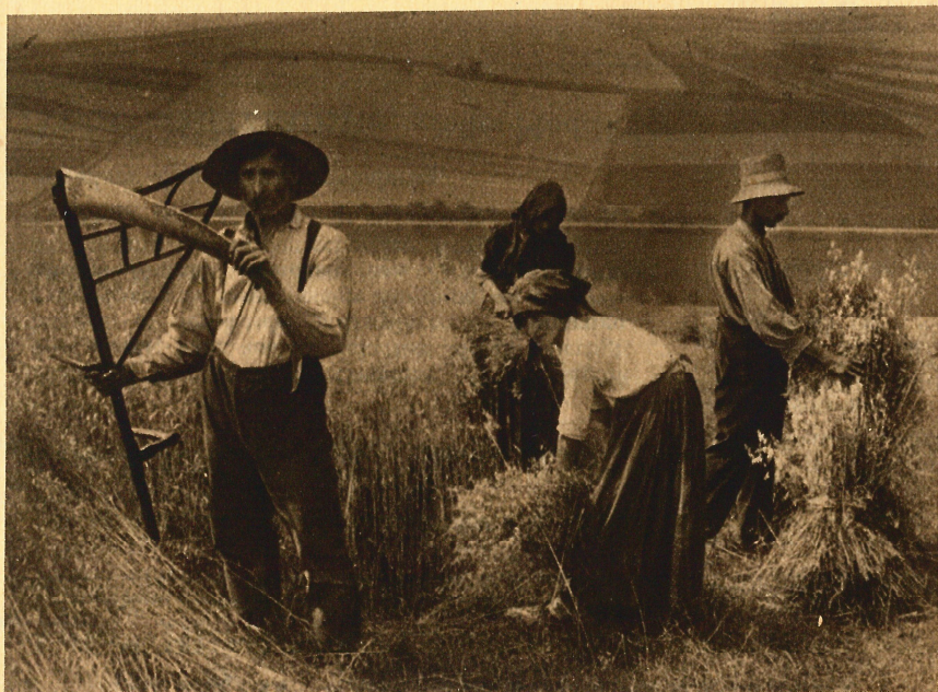
Aufgenommen mit „Agfa-Chromo“-Platte

Die exponierten Filme können ohne Zerstörung der Packung einzeln in denkbar einfachster Weise entnommen werden.