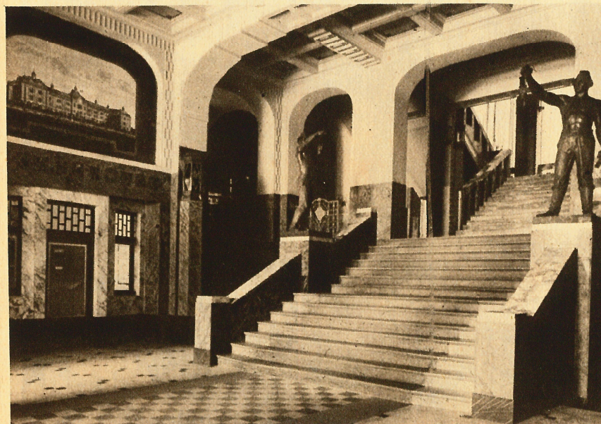
Aufgenommen mit „Chromo-Isolar“-Platte.