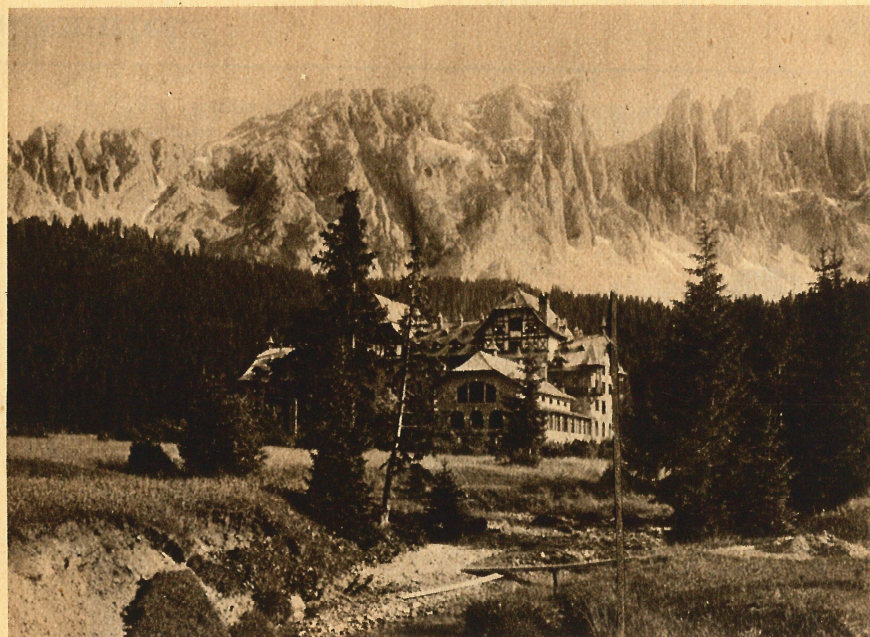
Aufgenommen mit „Chromo-Isolar“-Platte